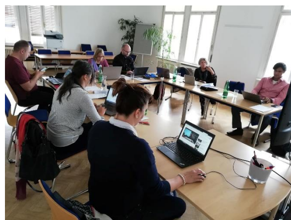
Intensos debates durante a 5ª reunião transnacional em Viena 😊

também poderá ser ensinado apenas parcialmente. Espera-se que a escolha dependa das necessidades de aprendizagem dos aprendentes. Parte da reunião focou-se nos eventos multiplicadores em cada país.